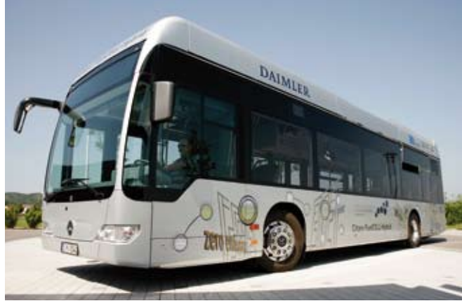
Mercedes-Benz Citaro FuelCELL Hybrid, Photo number: 09C547-023, Daimler AG