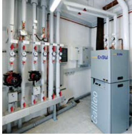
Galileo fuel-cell heating system, EnBW and Hexis AG