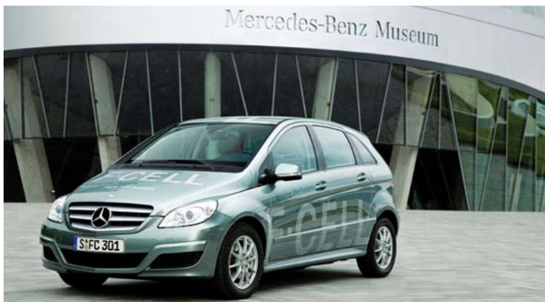
Mercedes-Benz B-Class F-Cell, Daimler AG