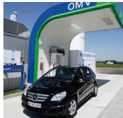
Mercedes-Benz B-Class F-Cell at the OMV hydrogen filling station in Stuttgart

The first public hydrogen filling station in Baden-Württemberg is located right next door to Stuttgart Airport, the New Stuttgart Trade Fair Centre, and one of Germany's key motorways. The facility is operated by oil and gas group OMV, gas company Linde, and automaker Daimler. New ion-compressor technology enables fuel-cell vehicles to be refuelled in a matter of minutes – just as quickly as filling up a conventional car. The combustion of hydrogen releases water only; emissions are free from pollutants such as the climate killer carbon dioxide.