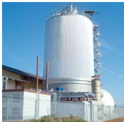
Bio-waste fermentation plant Leonberg, using molten carbonate fuel cell