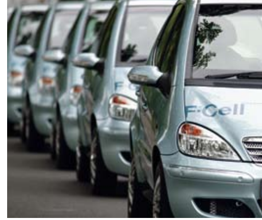
Mercedes-Benz A-Class F-Cell, Daimler AG