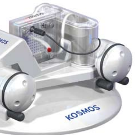
Fuel-cell experiment kit, Franckh-Kosmos Verlags-GmbH & Co. KG, Stuttgart

The region's universities provide a broad spectrum of relevant courses. In addition, the fuel-cell education and training centre in Ulm ( www.wbzu.de ) offers practical programmes for everyone impacted by the technology – whether in the world of industry, trade or education.